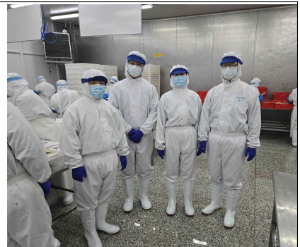
가공장 현장 점검