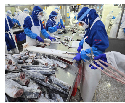
필렛 가공 현장 (1)