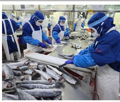
필렛 가공 현장 (2)